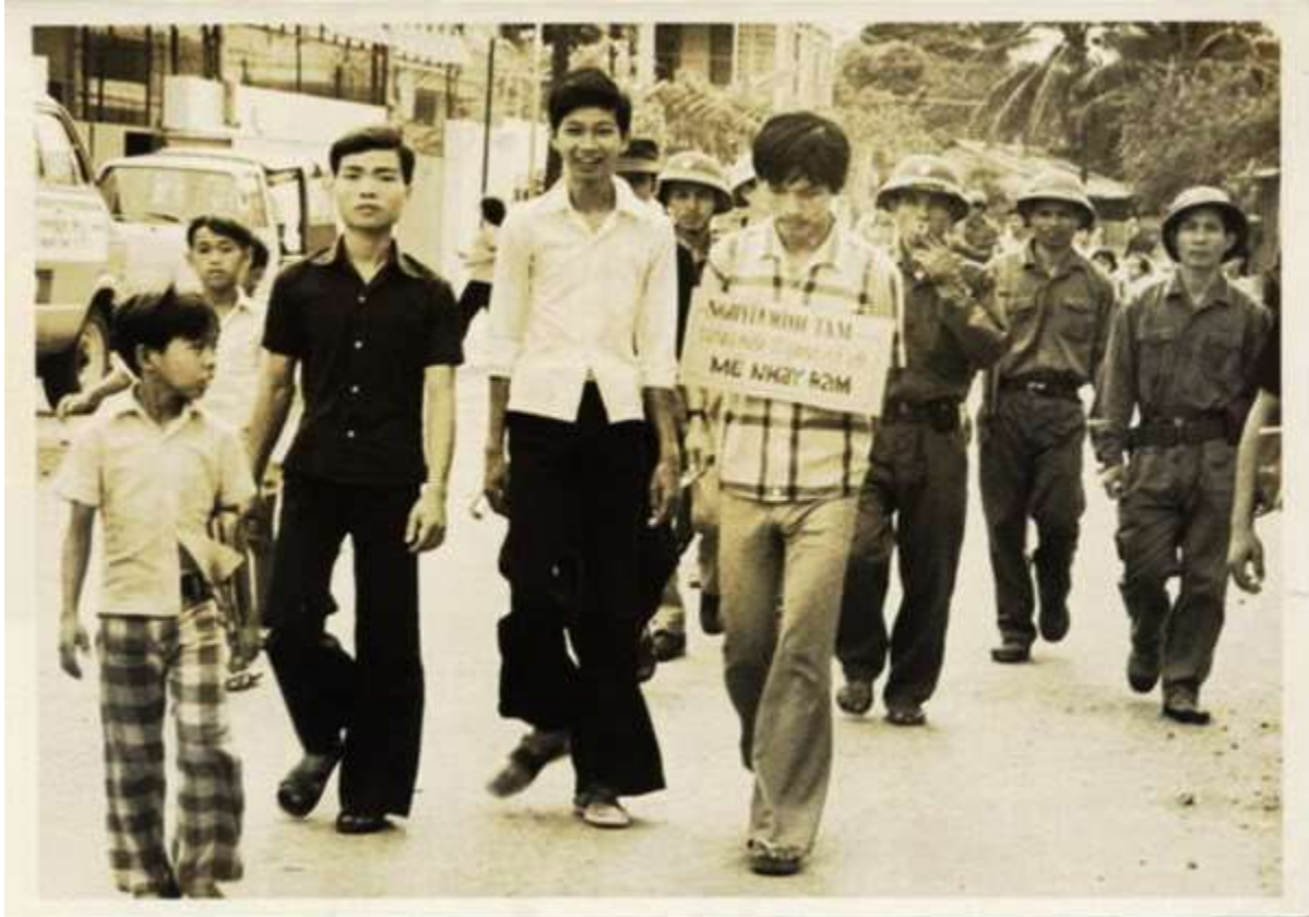
Một thanh niên bị bắt vì tội “mê nhảy đầm”! (file photo)

Tôi sinh ra trong gia đình cha là nhà báo, mẹ là nội trợ. Cha mẹ tôi là những người hiền lành tử tế. Tất cả những gì tôi được dạy dỗ từ lúc sinh ra đời cho đến năm 1975 dường như bị lật úp xuống. Thế giới của tôi, một cô gái 22 tuổi, bị bẽ vụn. Rất nhiều đêm sau vụ Nguyễn Thành Trung và những ngày đi tịch thu đồ đạc “của người khác”, tôi chênh vênh giữa sự trầm cảm và những cơn ác mộng, liên tục mơ thấy giấc mơ làm cô giáo của mình hóa thành cánh điều xanh lơ bằng giấy, điều vừa bay lên thì bị gió quật xuống, bị xé nát, rồi những mảnh xanh ấy bị bàn tay ai đó thô bạo ném vào trong lửa, ngọn lửa tàn bạo nóng rẫy đốt sạch mọi thứ không chừa lại thứ gì.